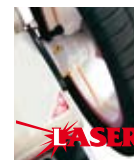
Sistema misura applicazione guidata dei pesi con puntamento Laser. Device to measure and apply adhesive weights the aid of a laser pointer.