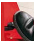
Freno elettromagnetico Pneumatic lock