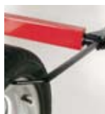
Tastatore esterno Outside input system