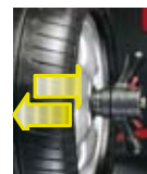
AIR-MAX Bloccaggio pneumatico Pneumatic lock