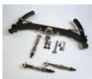
AMSF-HD-Pro Bike Kit Albero motocicli 14 mm. Motorcycle Adaptor kit 14 mm.